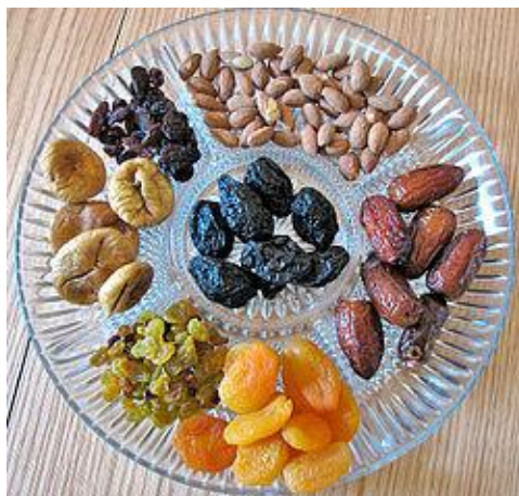
קערת פירות יבשים

המשמעות הגדולה של החג נתקבלה ע"י העליות שלפני קום המדינה ט"ו בשבט סימל את ההתעוררות הלאומית ואת תחיית היישוב העברי בארץ ישראל. כיום אימצו את בט"ו בשבט כחג של הטבע וחג שעוסק באיכות הסביבה.